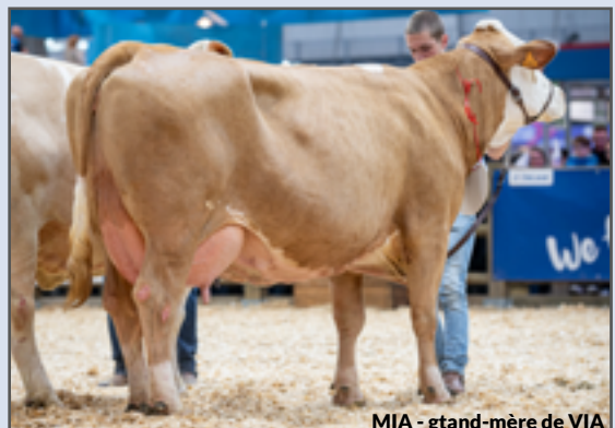
MIA - grand-mère de VIA