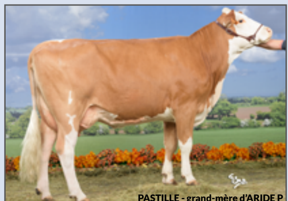
PASTILLE - grand-mère d'ARIDE P