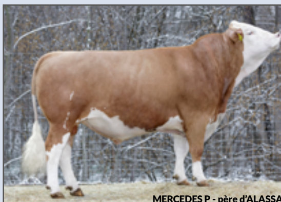
MERCEDES P - père d'ALASSA