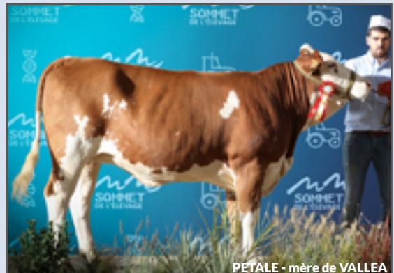
PETALE - mère de VALLEA