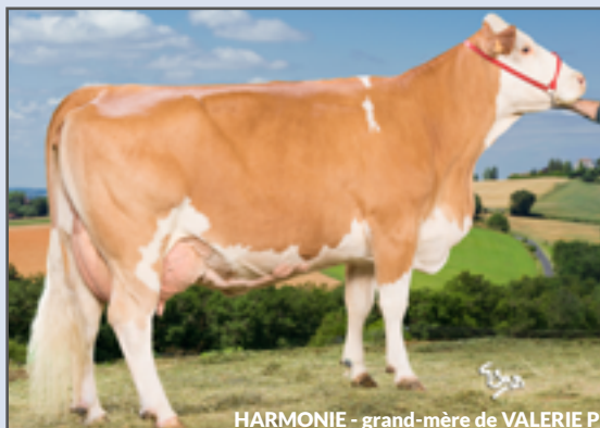
HARMONIE - grand-mère de VALERIE P