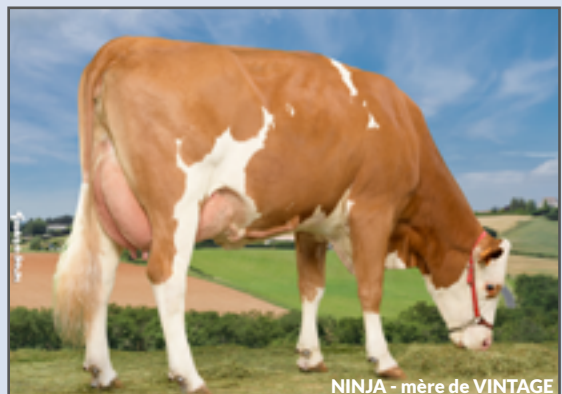
NINJA - mère de VINTAGE