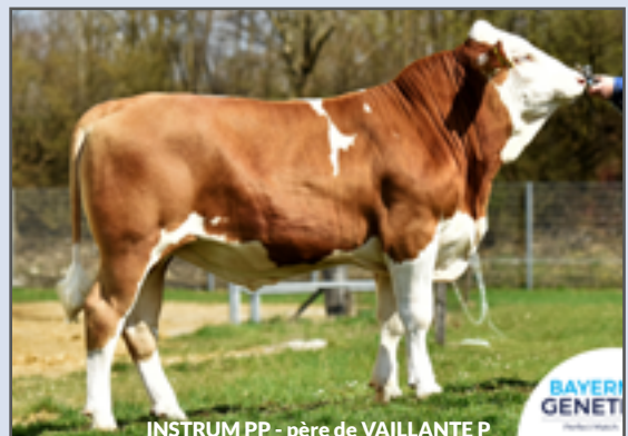
INSTRUM PP - père de VAILLANTE P