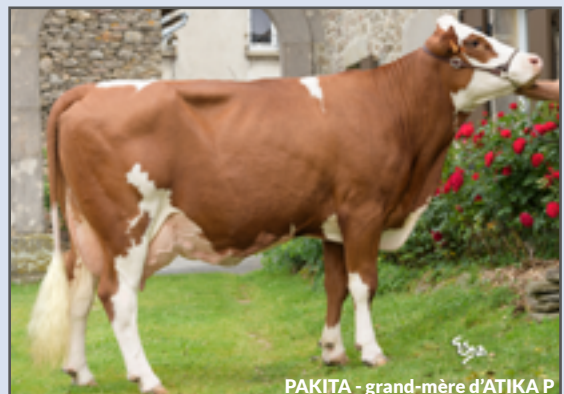
PAKITA - grand-mère d'ATIKA P