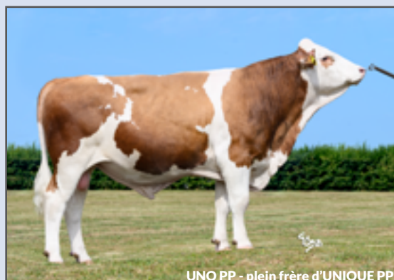
UNO PP - plein frère d'UNIQUE PP