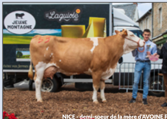
NICE - demi-sœur de la mère d'AVOINE P