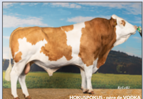
HOKUSPOKUS - père de VODKA