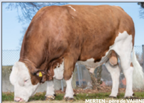
MERTEN - père de VAHINE