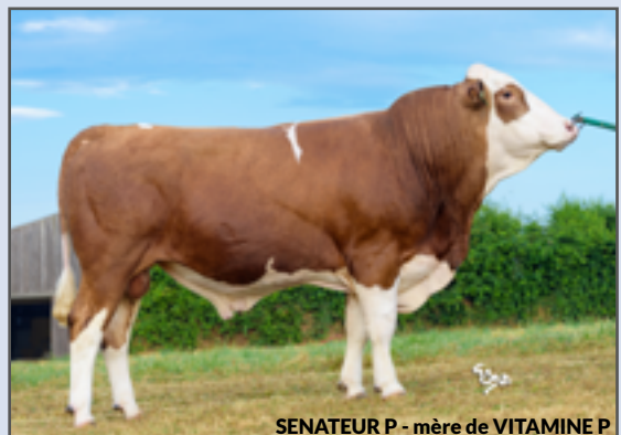
SENATEUR P - mère de VITAMINE P