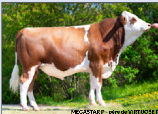
MEGASTAR P - père de VIRTUOSE P