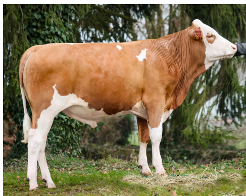
Avec 177 points d'ISU, UNIC P se classe aujourd'hui parmi les meilleurs taureaux Simmental Européens

En décembre 2025, notre indexeur, GENEVAL, a aussi revu les formules de conversions des taureaux étrangers en base française. De nouveaux ajustements ont été réalisés. Leurs index étrangers n'ont pas bougé mais ils ont perdu en moyenne 400 kg de lait et 0.5 point sur les fonctionnels en base française. Tous nos animaux ont aujourd'hui des ascendants étrangers dans leur pedigree. Les nouvelles formules de conversion ont donc aussi