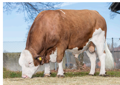
MERTEN reste le taureau leader en ISU de notre offre. Ses 166 premières filles confirment son excellent potentiel : 789 Lait, +1.5 TP et 138 MO