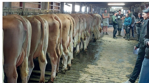
Assemblée Générale Syndicat de l'Ain

Ces AG sont toujours des moments riches en échanges où les éleveurs, techniciens, conseillers se rencontrent pour parler météo, sanitaire, production laitière, mais surtout