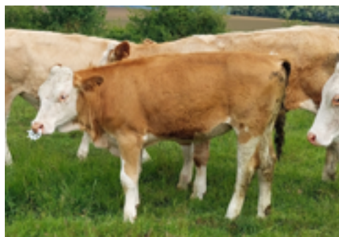
N°55 - VACHETTE