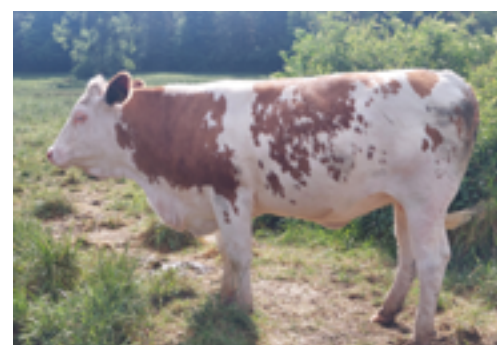
N°18 - UPILA