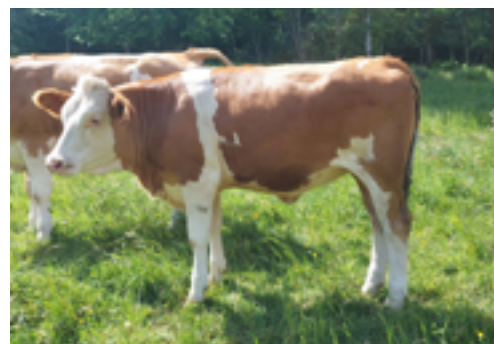
N°44 - UNIFLORA