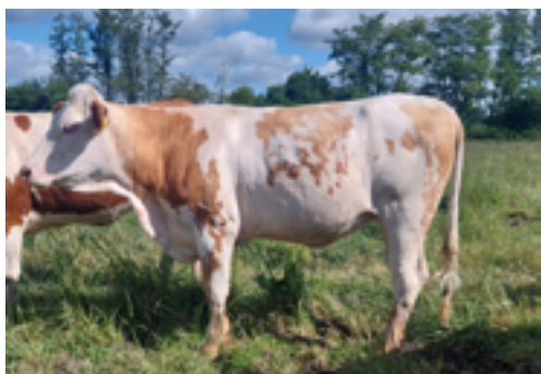
N°10 - UMIA