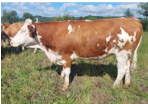
N°11 - URO