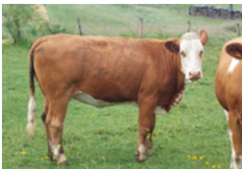
N°5 - TULIPE