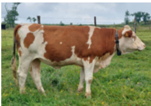
N°37 - UNITAIRE