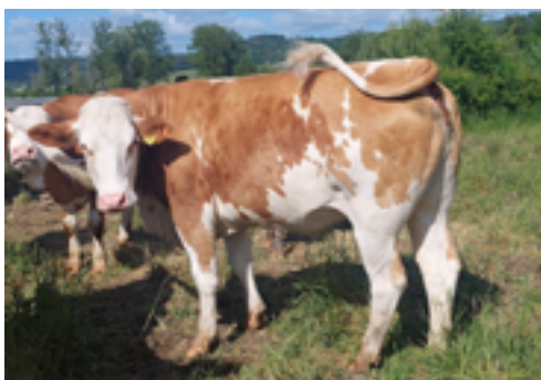
N°8 - TING