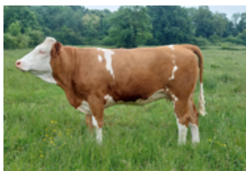
N°30 - ULTIME