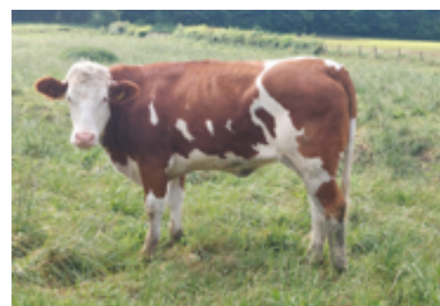
N°32 - URIMOLE