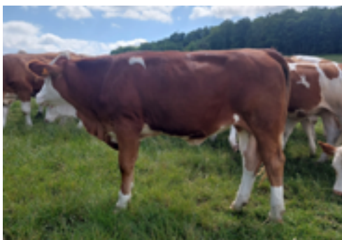
N°52 - VANESSA P