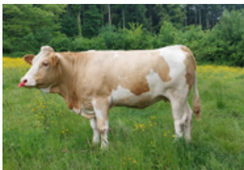
N°4 - TRADITION