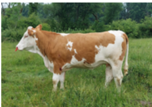
N° 34 - ULRICA