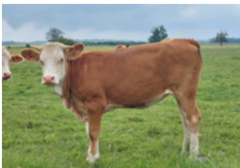
N°43 - USINEE