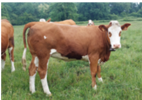
N°28 - USHUAIA