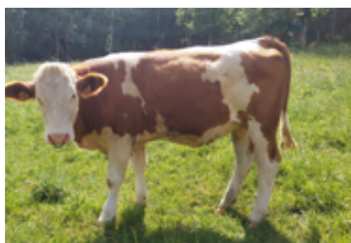
N°45 - UGLY P