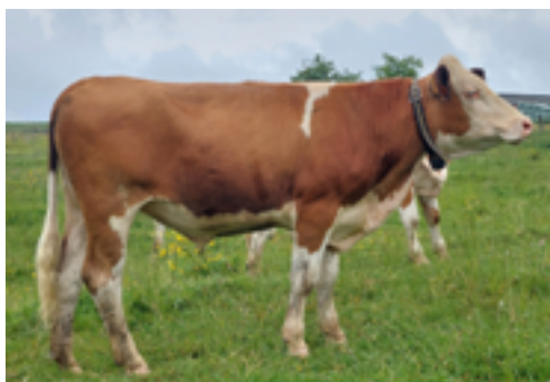
N°24 - ULTIME