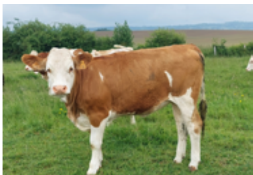
N°42 - URSULINE