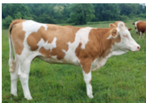
N°31 - ULYSSE