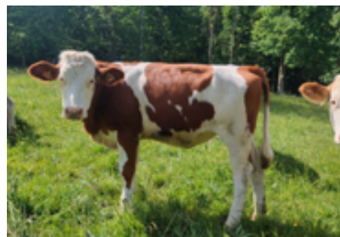
N°50 - UJUBE