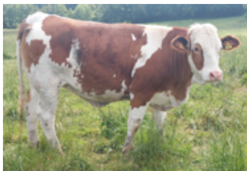
N° 22 - UPERLE