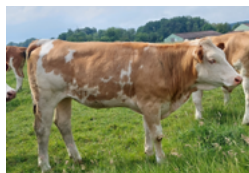
N°41 - URGENCE