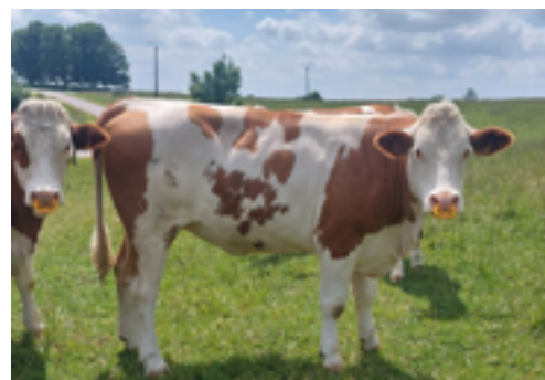
N°12 - UKRAINE P