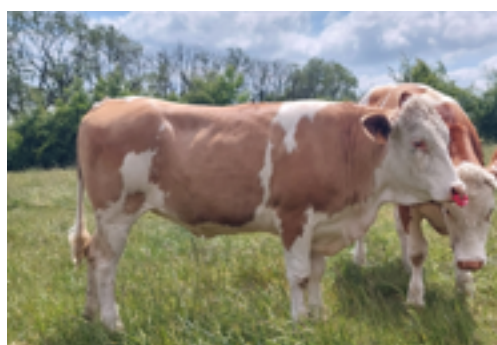
N°16 - ULKA P