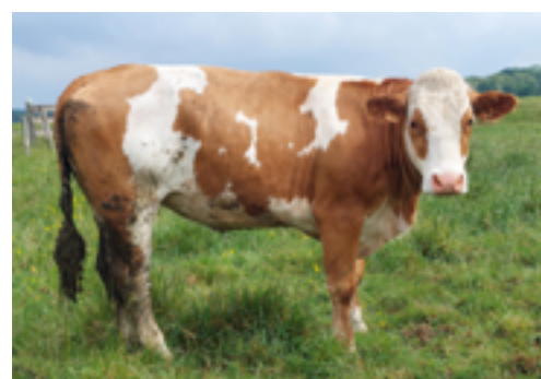
N°3 - TOSCANE