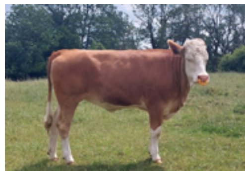
N°38 - UREE P