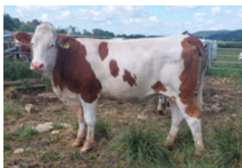
N°39 - ULME