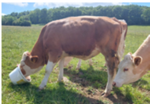
N°51 - UNITY