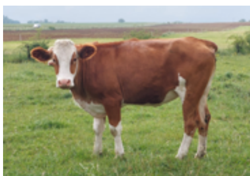
N°17 - ULEMA