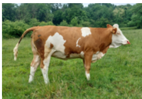
N°1 - THEORIE