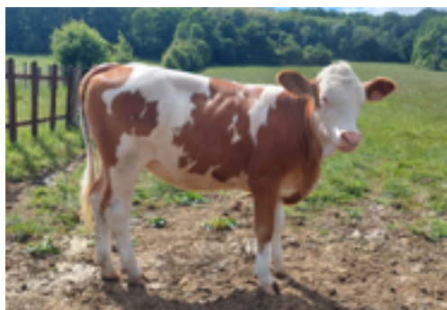
N°54 - VOYANTE P