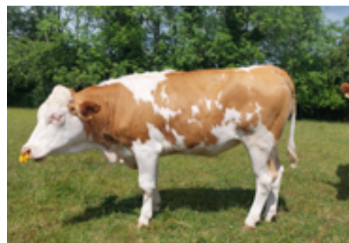
N°26 - USANTE