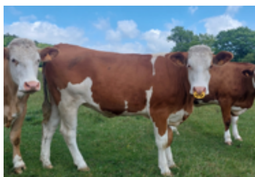
N°13 - ULULU