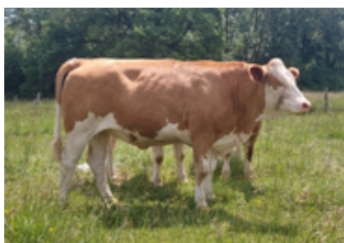
N°2 - TAVERNE