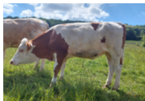
N°47 - ULYSSIA