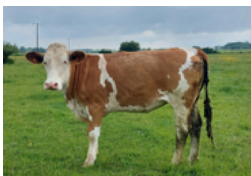
N°40 - URFEE