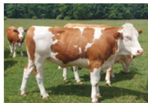
N°15 - ULOTTE