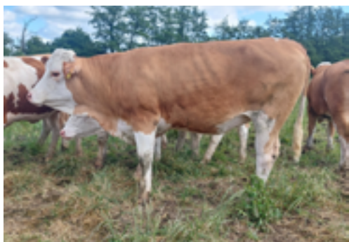
N°33 - UNETTE