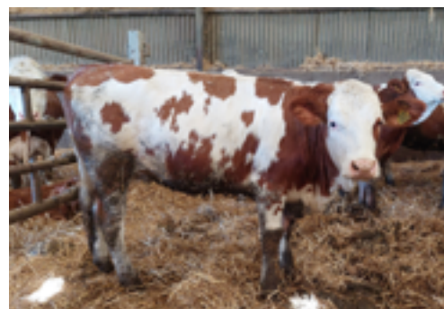
N°53 - VERONE