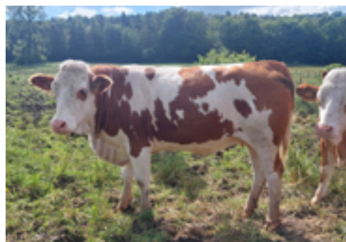
N°6 - TIME