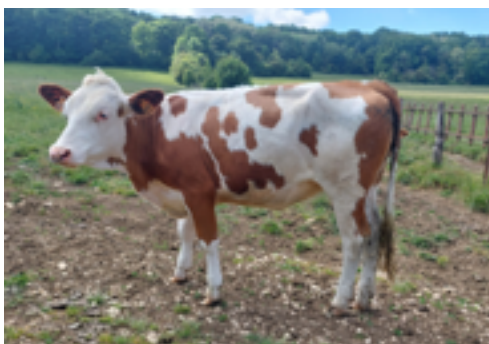
N°49 - UETTE