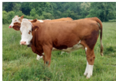
N°29 - UZOZ