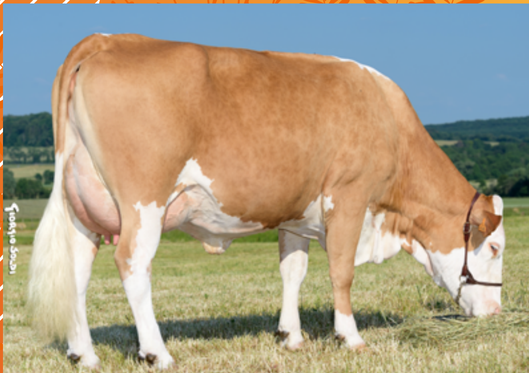
Roma, mère de URIAGE (N°23 au catalogue) - GAEC FERME DU VAL