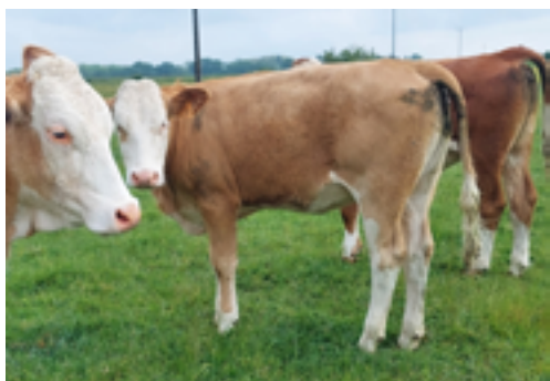
N°48 - UTOPIE