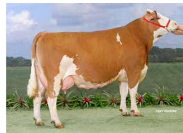
◀ VENDEE EX91. Meilleure mamelle jeune et adulte Eurogénétique et championne jeune Eurogé- nétique