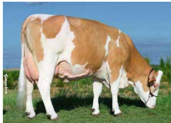
◀ HÉMA TB84 mère du taureau JAFFAR