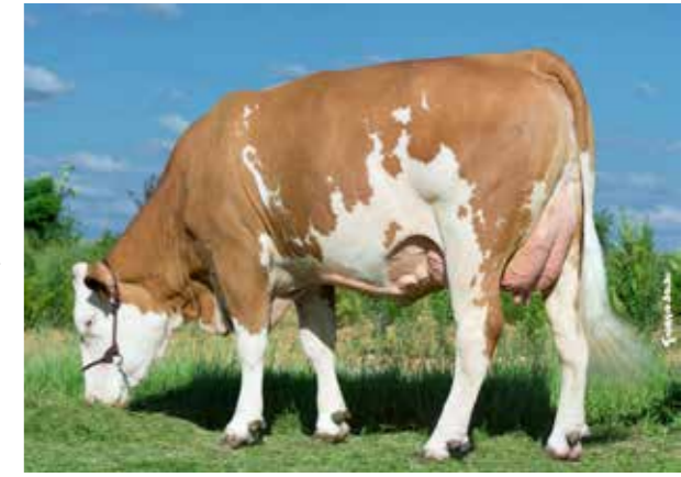
IDEALE ▶ TB87 Meilleure ma- melle Cèstres 2016