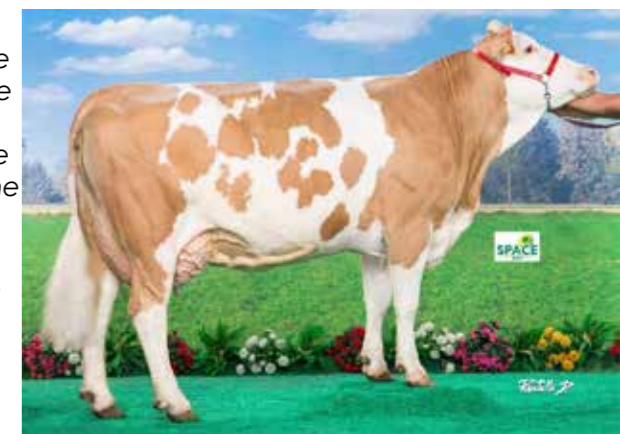
HAWAÏ ▶ TB87. Grande championne du Spécial Simmen- tale Space 2017