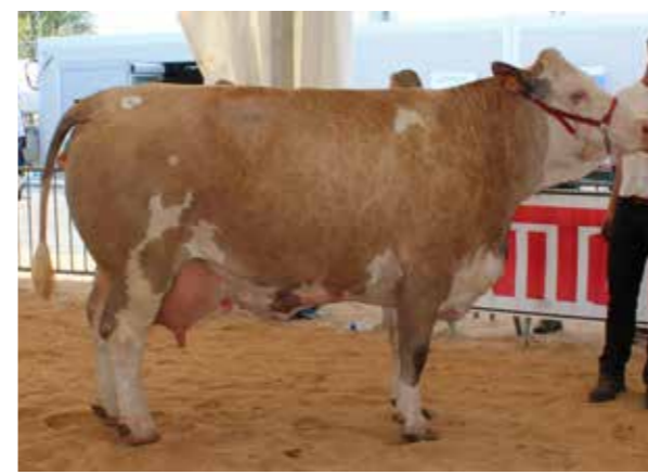
◀ GAMINE EX93 Meilleure bouchère SIA 2016, mère du taureau Ibis et grand-mère du taureau Spirou