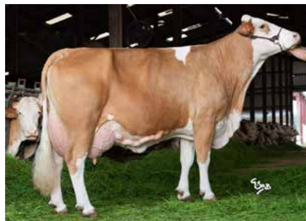
◀ INÉDITE TB87 mère des tau- reaux Nikos et Sénateur P