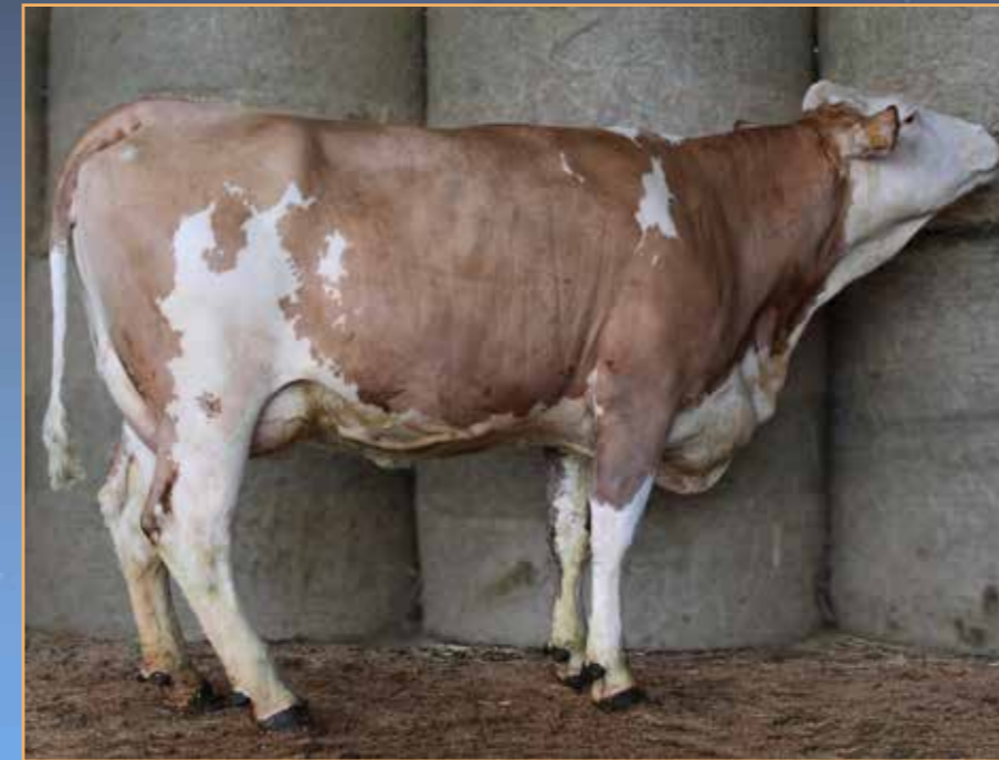
◀ RHEA (MINOR/ VIADUC)

Dernier vêlage le 27/12/2022 (L1) IA 23/02/2023 par HONK