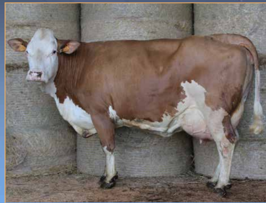
◀ NEBULEUSE (WATNION/RAYMAN)