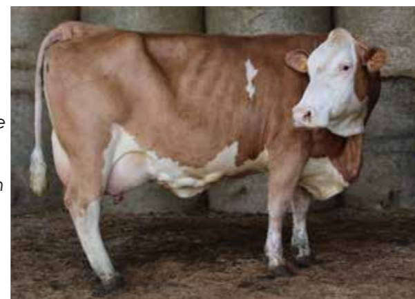
MYRANDA ▶ TB87, N°42 de la vente