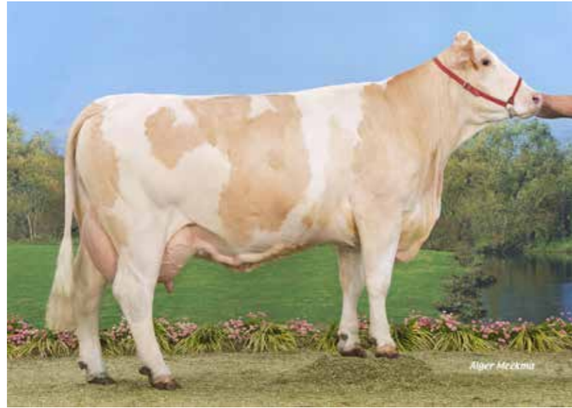
◀ ÉBÈNE EX90 mère de 14 femelles du troupeau