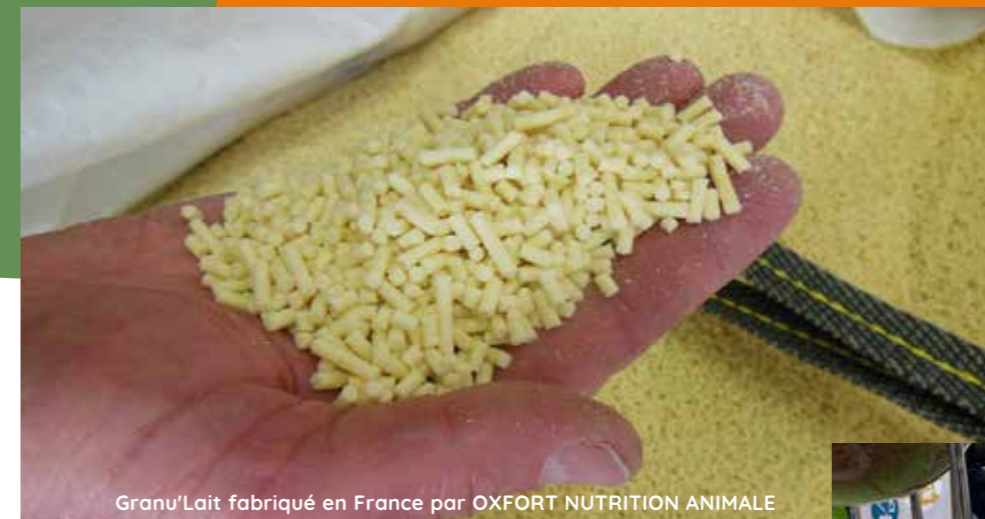
Granu'Lait fabriqué en France par OXFORT NUTRITION ANIMALE

En incorporation à 5% dans les pré-starters et les starters mash pour une bonne transition et augmenter la consommation d'aliment.