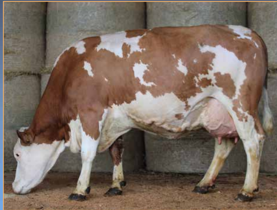
◀ ORGE (WALDFEUER / RAYMAN)

Dernier vêlage le 04/01/2023 (L3) IA 17/02/2023 par HONK