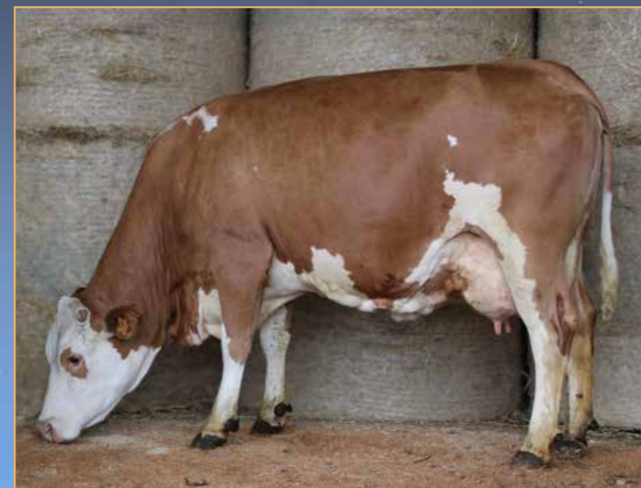
◀ OHMYGOD (MIAMI / WILLE)