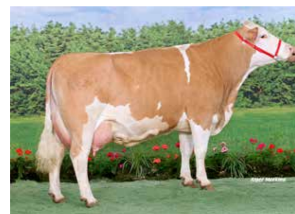
◀ UNIVERS EX90. Championne adulte Eurogé- nétique 2010 et championne adulte du Spé- cial Simmental Space 2009