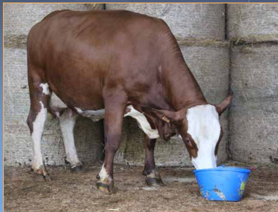
◀ PAPOUILLE (VIANTOR / HERZ)