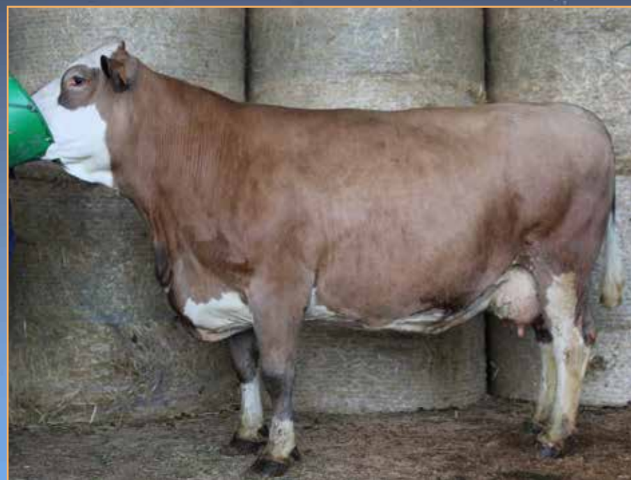
◀ NECTARINE (IBIS / TIROLIEN)

Dernier vêlage le 14/07/2022 (L3) IA 17/09/2022 par SEDUISANT