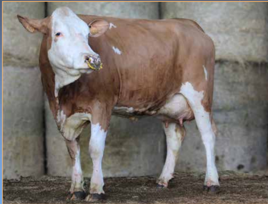
◀ RETA (MANRIQUE P/ ILLUMINATI)

Dernier vêlage le 14/12/2022 (L1) IA 10/02/2023 par SEDUISANT