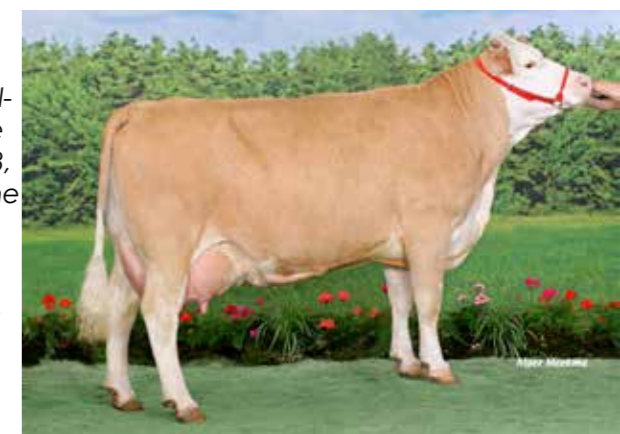
SATURNE ▶ TB87. Meilleure mamelle jeune et adulte Euro- génétique