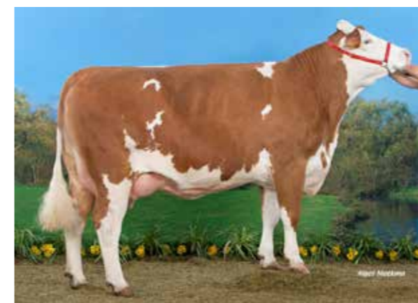
◀ EPINAL EX93. Cham- pionne et meil- leure mamelle jeune SIA 2013, et championne jeune Eurogé- nétique 2013