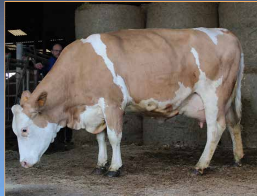
◀ ONDA (VOGT/VIGARO)