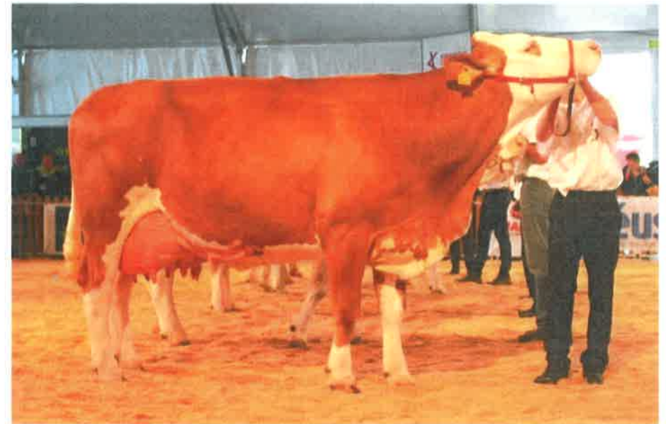
BEGONIA Mère de LUCIE en 7 ème veau : - 1ere de section Cournon 2016 - 9DE, 6MU, 8MA, 6AP - 91 de Note Globale