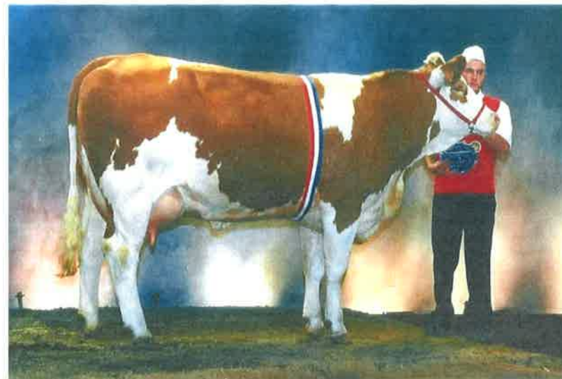
PIVOINE en cours de 1er veau :