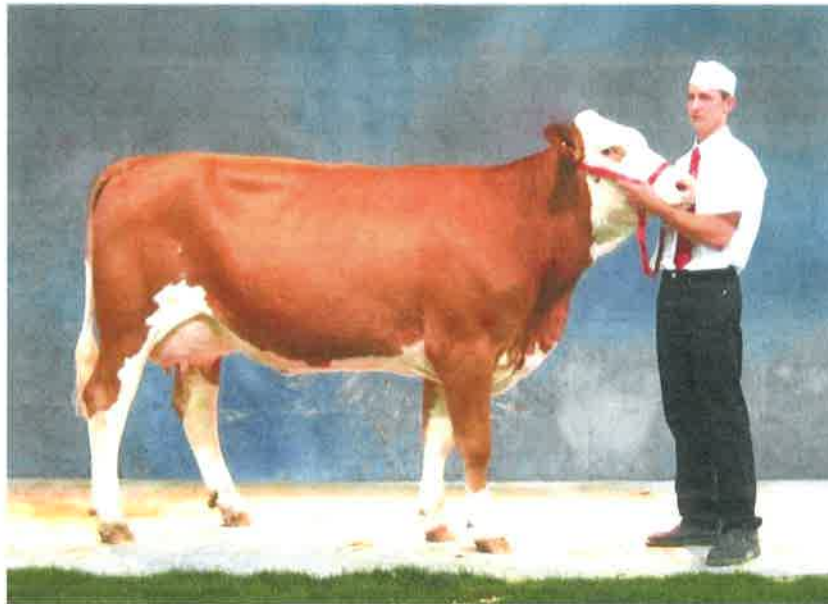
BEGONIA Mère de LUCIE en 1 er veau : - Meilleure mamelle jeune 2009

Avec LUCIE, vous pouvez acquérir de la morphologie exceptionnelle : une fille de la souche Hofherr BEGONIA 91 sur Uterino LAGUNE 89.