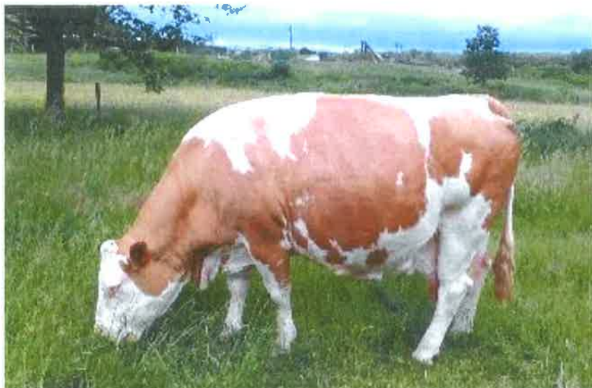
DALHIA en cours de 5ème veau

Une souche laitière hors norme, alliant à la fois la production avec des taux impeccables et une régularité dans la morphologie !