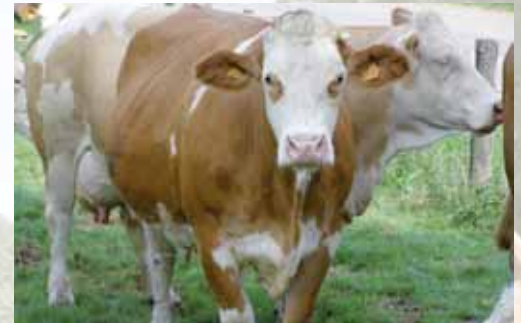
Boulette : Mère de la N° 76 au catalogue