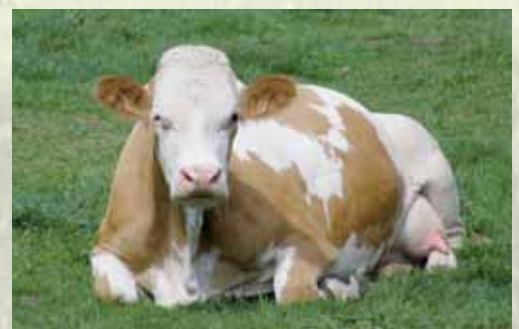
8471 : Mère de la N° 19 au catalogue