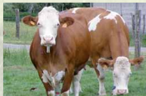
8012 : Mère de la N° 68 au catalogue