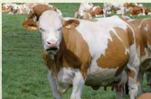
8245 : Mère de la N° 67 au catalogue