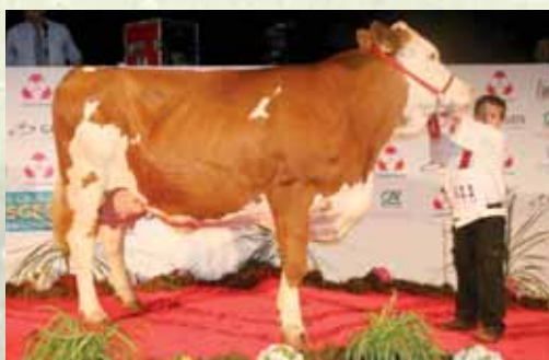
8581 : Sœur de mère de la N° 1 au catalogue. 3 ème de section à Eurogénétique 2012