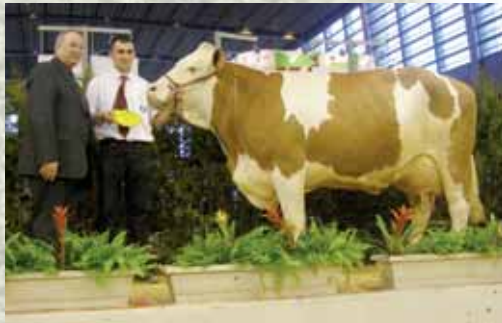
8498 : Soeur de mère de la N° 75 au catalogue Championne jeune à Paris 2012