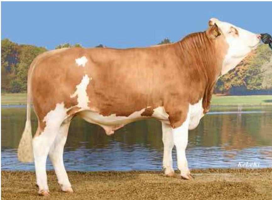
EDELSTEIN, PÈRE DE TULIPE