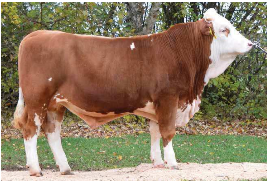
WALDURIS, PÈRE DE TOSCANE