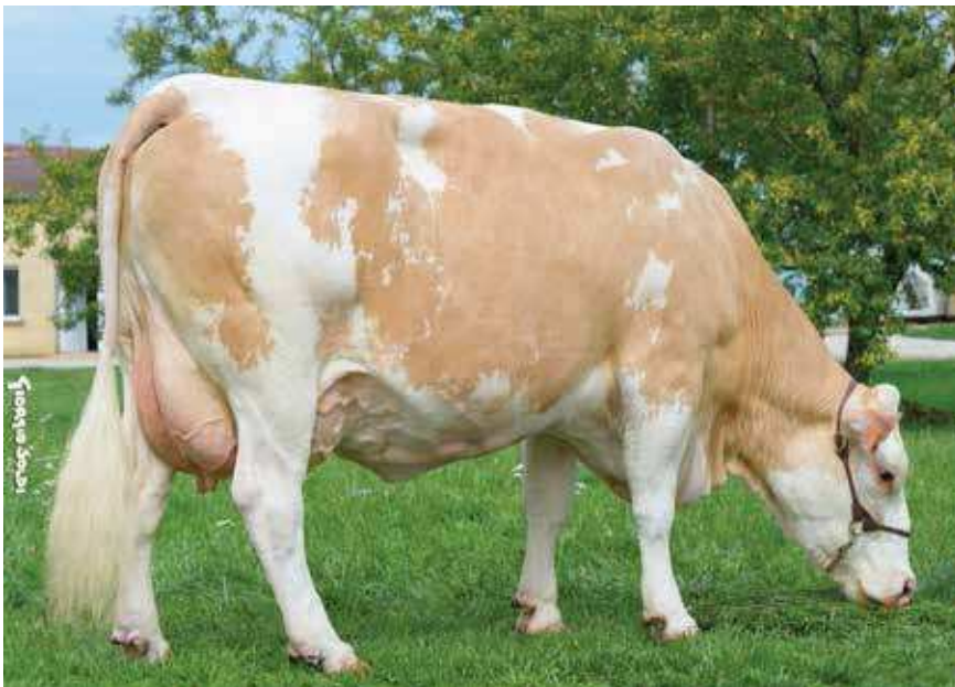
2399, MÈRE DE 3097