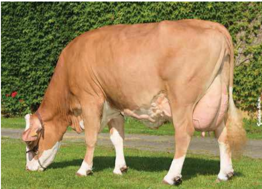
RAMBA, MÈRE DE TRABAN