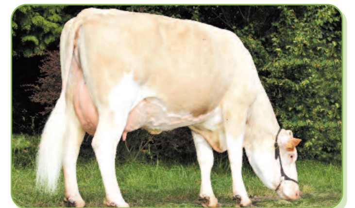
Ariane (Fille de Tirolien) à l'EARL Stoller (39)