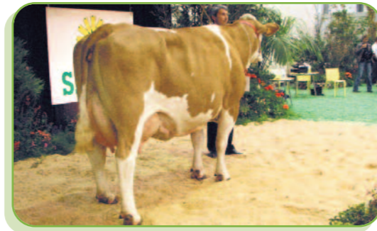
Univers au GAEC du Creux Bleu (21)