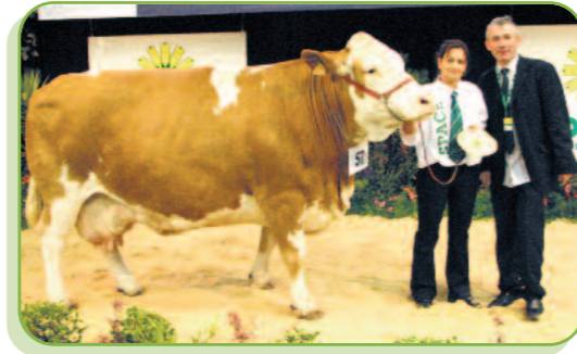
Salsa au GAEC Vauchet (39)