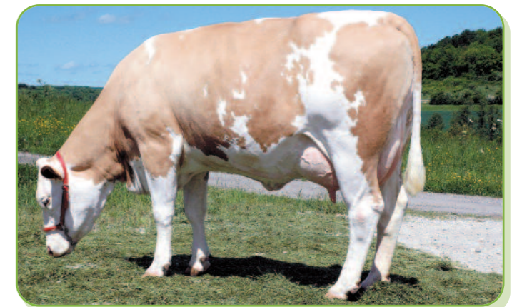
Banquise (Fille d'Ushaia) au GAEC des 3 Fontaines (52)

URAIISON semble moins laitier (+525 kg). Il fait son INEL avec un fort index TB (+5,0) tout en laissant le TP proche de la neutralité (-0,2). Côté morphologie, il semblait un peu moins intéressant que son demi frère. Ses dernières filles seront toutefois suivies avec attention.