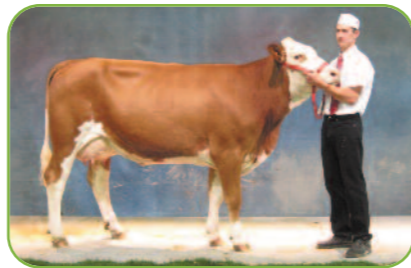
Begonia au GAEC La Touffière (74)