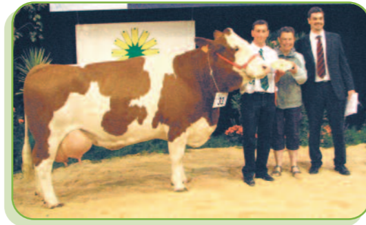
Versaille à l'EARL de la Basse Cour (72)