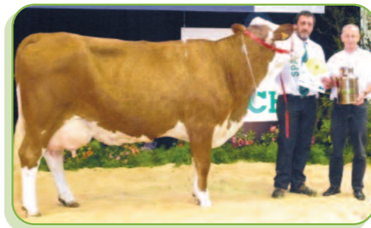
Pistache au GAEC Aubry (21)