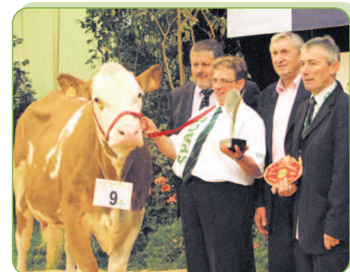
Belle au GAEC St Hubert (52) Grande Championne du SPACE 2009

La bonne présentation de cette année restera dans les mémoires et aura permis de rapprocher les éleveurs du berceau de la race de ceux des régions Bretagne et Pays de la Loire.