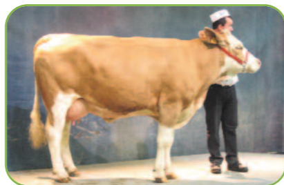
Blonde au GAEC La Léchère (01)