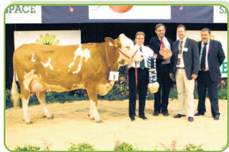
Belle au GAEC St Hubert (52)

Une vente aux enchères de 4 jeunes génisses françaises, ainsi que 5 animaux allemands et autrichiens est ensuite venue clôturer en beauté la matinée consacrée à la race. Tous les animaux ont trouvé preneur et feront bientôt le bonheur de nouveaux éleveurs Bretons. Meilleure enchère pour une génisse pleine Allemande achetée 2750 Euros par un éleveur des Côtes d'Armor.