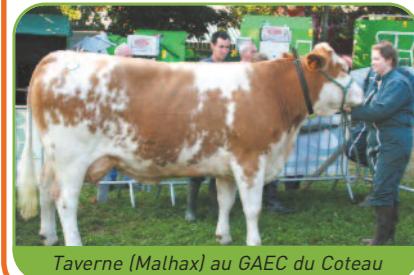
Taverne (Malhax) au GAEC du Coteau