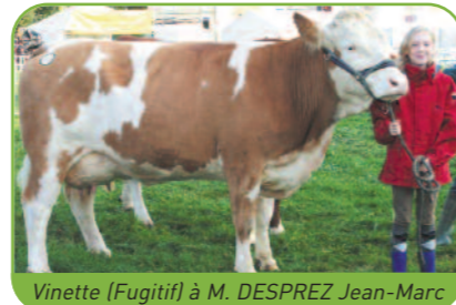
Vinette (Fugitif) à M. DESPREZ Jean-Marc